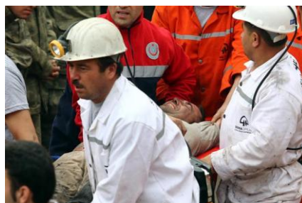
(HD 紙インターネット版より)

(2) 現在まで確認された死亡者は 282 名となり、トルコ共和国史上最悪の炭鉱事故となった。未だ 100 名以上の坑夫が炭鉱内に閉じ込められている模様。トルコ国内・在外政府機関は 13 日から 3 日間喪に服するため、国会を除く全ての公的場所において半旗が掲げられた。